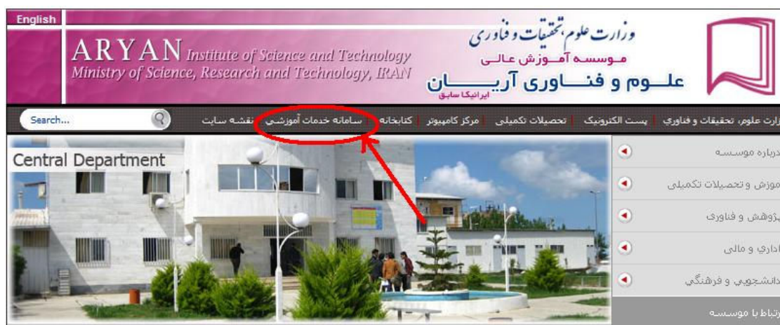
شکل ۱: صفحه اول وب سایت موسسه

۱- به وب سایت خدمات آموزشی دانشگاه به آدرس www.edu.aryan.ac.ir مراجعه نموده و یا با مراجعه به وب سایت دانشگاه و کلیک روی کلمه سامانه خدمات آموزشی در بالای صفحه اصلی وب سایت مطابق شکل (۱) کلیک نمایید.